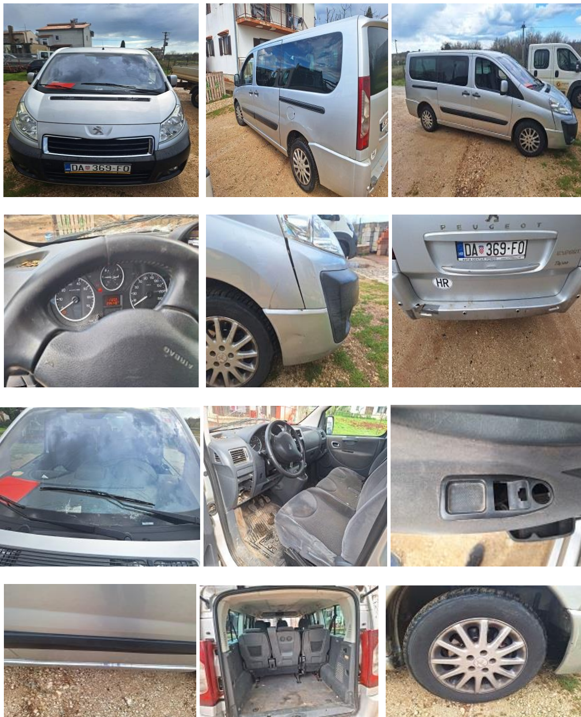
Pogled na vozilo PEUGEOT EXPERT 2.0 HDI ALLURE

Županijski sud: rješenje broj: 4 Su-1039/10 od 13. srpnja 2022.